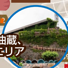
道の駅くるくるなると

2022年 12月10日(土)・11日(日)・17日(土)・18日(日)・24日(土)・25日(日)